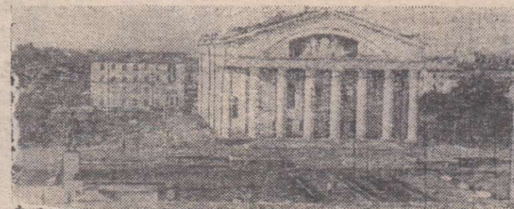
МАРИЙСКАЯ АССР. Столица республики — Йошкар-Ола. Площадь имени Ленина.

4 ноября исполняется 50 лет со дня получения автономии марийцами, удмуртами и калмыками. Только с победой Великой Октябрьской социалистической революции, впервые в истории эти ранее отсталые народы получили национальную государственность, началось их возрождение. За полвека Советской власти трудящиеся Марийской, Удмуртской и Калмыцкой АССР достигли больших успехов в развитии промышленности, сельского хозяйства, культуры. Сейчас они вносят достойный вклад в дело строительства коммунизма в нашей стране.